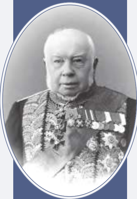
Н.И. Стояновский (1821—1900). Один из основных разработчиков Наказа Судебным Следователям

Только после принятия начальством в каждом конкретном случае распоряжения о производстве предварительного следствия и возложения на указанных должностных лиц соответствующей процессуальной функции они именовались «производителями следствий» (ст. 91), «производящими следствием» (ст. 105, 143), «следователями» (ст. 86, 102, 106, 107, 159, 160, 168, 175, 180, 199, 220, 240, 243 кн. 2 Военно-уголовного устава). Термин «воинский следователь» встреча-