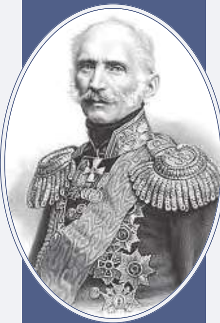
Военный министр Н.О. Сухозанет

Сравниваемые документы издавались в тот период, когда уже были проведены работы по систематизации правовых норм, регулировавших порядок уголовного судопроизводства по преступлениям и проступкам, подлежавшим рассмотрению общими судебными местами 8 и военными судами 9 . Введение в действие и Наказа, и Инструкции существенно меняло состав нормативных правовых актов и их соотношение по юридической силе в системе правовых основ производства предварительного следствия.