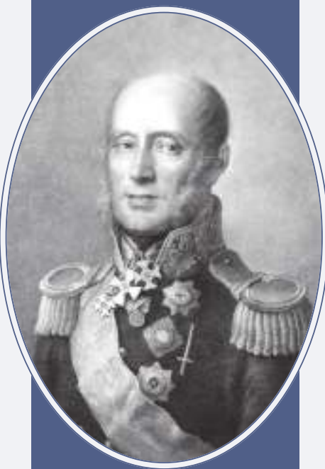
Главнокомандующий 1-й армией генерал-фельдмаршал князь Михаил Богданович Барклай де Толли Фрагмент портрета. Гравюра К.А. Зенффа Государственный Эрмитаж (Санкт-Петербург)

В содержание Инструкции входят 92 статьи и приложение (форма общей дневной записки военного следователя). В отличие от Наказа она не разделена на пронумерованные главы и входящие в них отделения, хотя при её подготовке применены аналогичные Наказу тематическая группировка и последовательность изложения норм. 59, или 64,1 проц., статей Инструкции дословно воспроизводят нормы На-